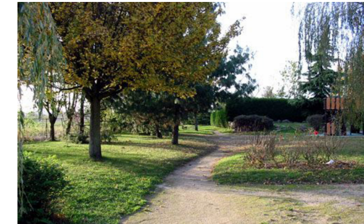
La commune de Villaines-sous-Bois