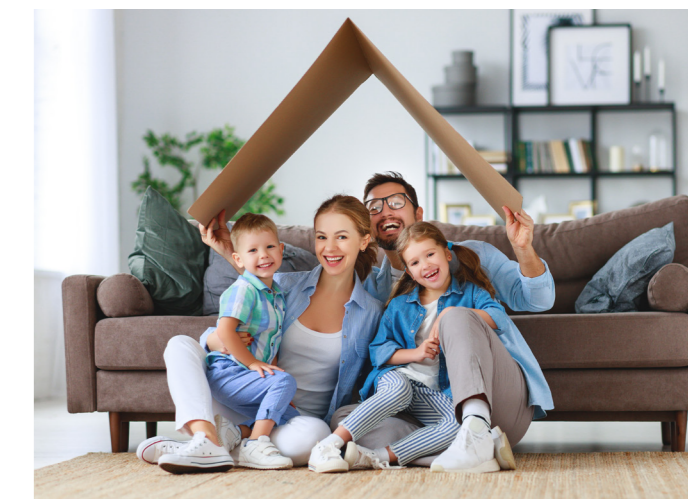
Livraison de la résidence : 1 er semestre 2023.