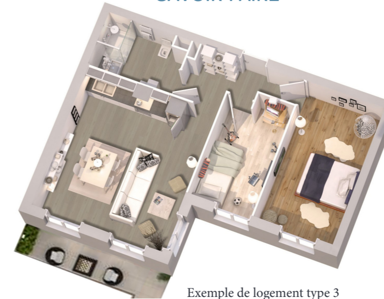
Exemple de logement type 3

CUISINE ÉQUIPÉE EN OPTION BALLON THERMODYNAMIQUE LOCAL DEUX ROUES CHAUDIÈRE GAZ INDIVIDUELLE JARDINS ET TERRASSES PRIVATIFS CONSEIL ÉCOUTE CLIENT S.A.V. SAVOIR-FAIRE