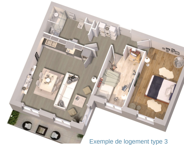
Exemple de logement type 3